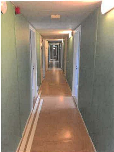
Rummen och korridoren har fått en uppfräschning