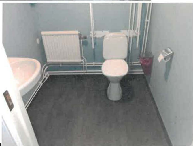
Nytt på handikapptoa