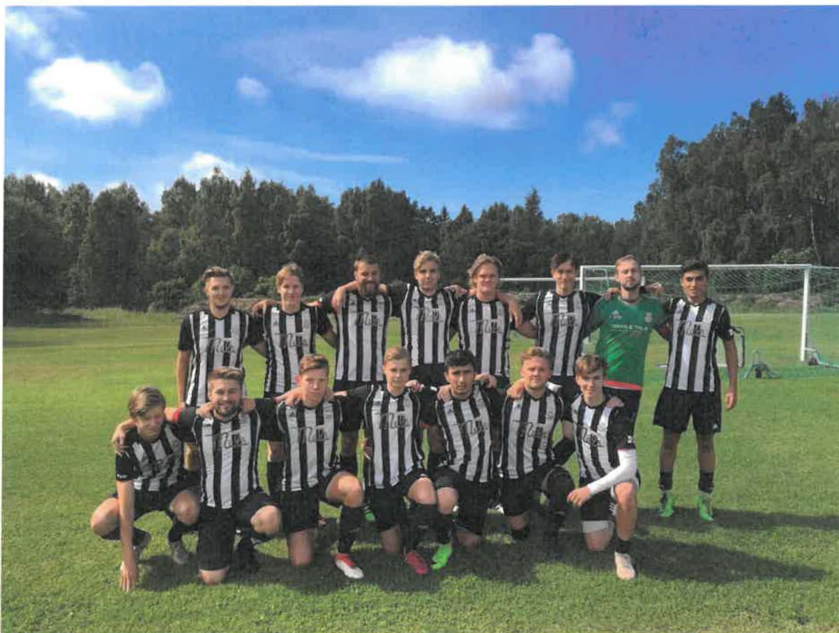
Foto: Truppen som var med och slog IFK visby med 1-5 borta på Västerhejde IP.