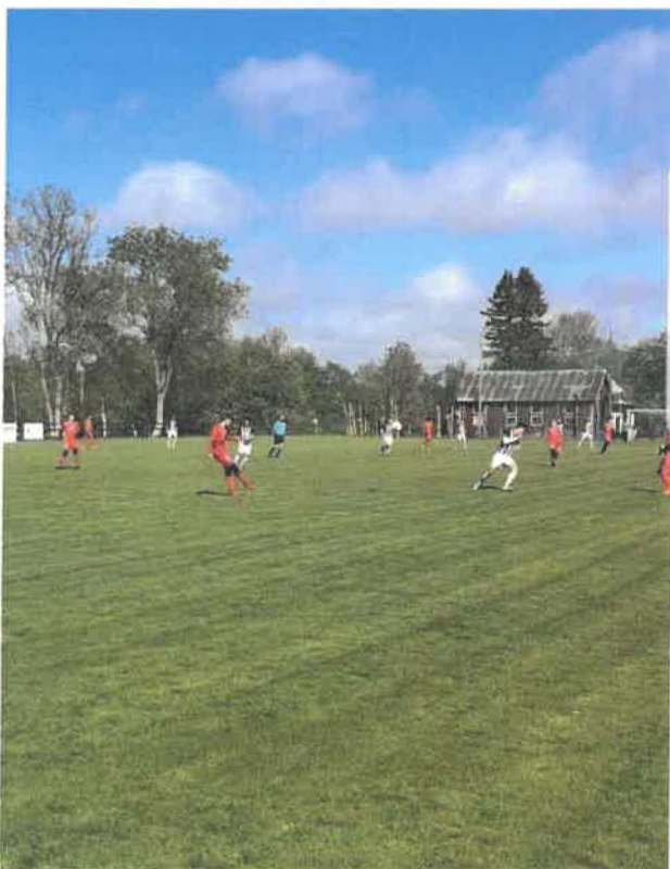
Foto: Överblick från Fardhem, Borta mot Fardhem Garda BK.