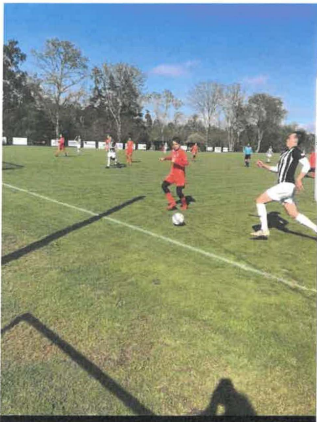
Foto: Tino försöker hinna ikapp en boll, Borta mot Fardhem Garda BK.