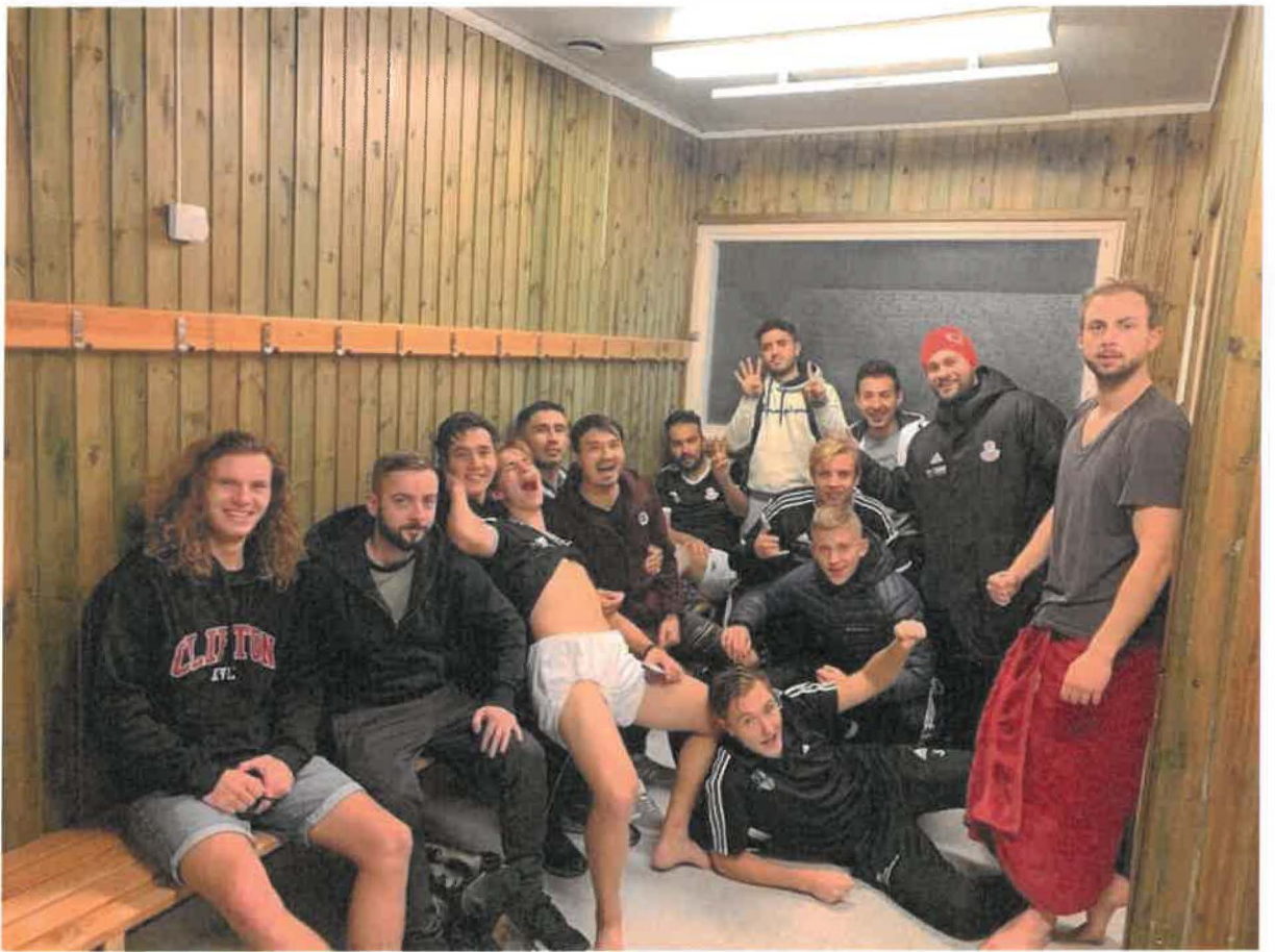
Foto: B-laget som var med och vann borta mot Levide IF med 1-4 i Hemse.